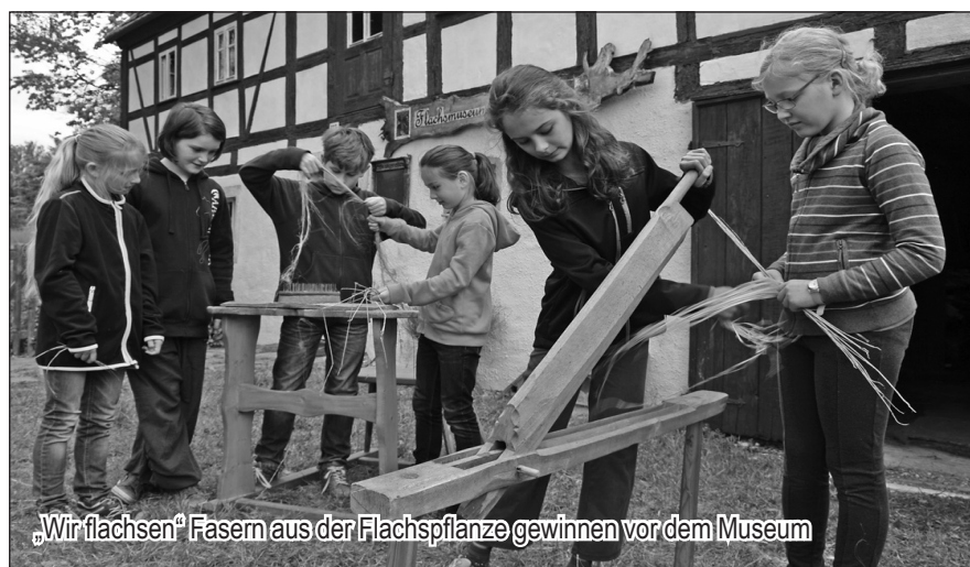
„Wir flachsen“ Fasern aus der Flachspflanze gewinnen vor dem Museum