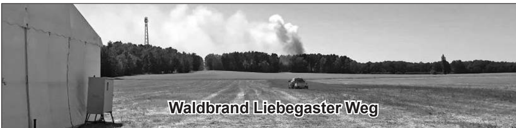
Waldbrand Liebegaster Weg

Die nächste Sprechstunde des Friedensrichters findet am